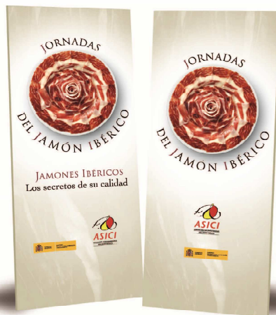
Enaras y Displays