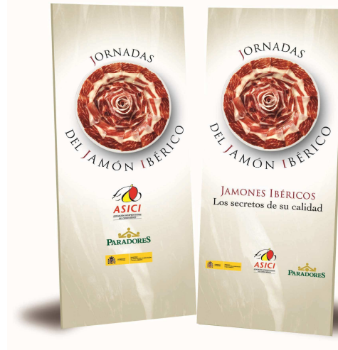
Enaras y Displays